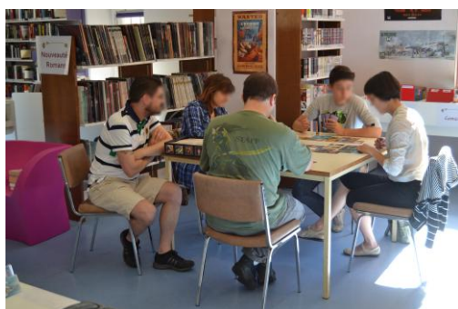
Tournoi de jeux de société.