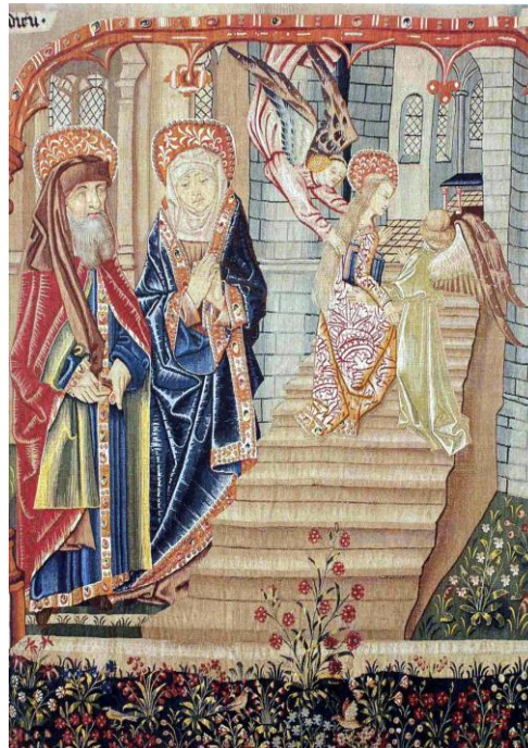
Présentation de la Vierge au Temple.

Renseignements aux 03.80.24.77.95 / 03.80.24.57.71