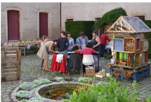
Vente de livres réformés.