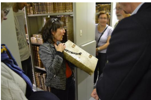
Visite du fonds patrimonial.