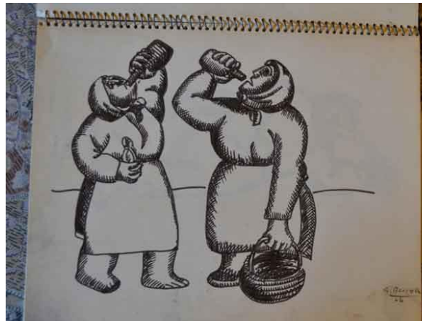
Album Vendimia 1966 dessin à la plume

Vers 1964, l'artiste fait la rencontre à Düsseldorf de sa future compagne, Paule di Puccio, une femme de lettres, originaire de Savigny-les-Beaune. Paule, qui est issue d'une famille d'italiens exilée en France est une femme très engagée puisqu'elle milite à l'époque contre la guerre d'Algérie. Elle est également la secrétaire d'Elsa Triolet, connue pour ses talents littéraires mais aussi pour être la muse de Louis Aragon. Le couple Becerra – di Puccio élit alors domicile à la Cité internationale des Arts de Paris d'octobre 1964 à février 1967. Cette année là, ils quittent Paris et s'installent définitivement à Savigny-les-Beaune, dans la belle et vaste propriété familiale de Paule. Jusqu'en 2012, German Becerra va partager sa vie entre Düsseldorf où il a un atelier et cette petite commune de Côte d'Or, au sein d'une ancienne cuverie reconverte en maison-atelier. Depuis 2012, il s'est replié à Savigny, après avoir fait rapatrier ses œuvres provenant de Düsseldorf.