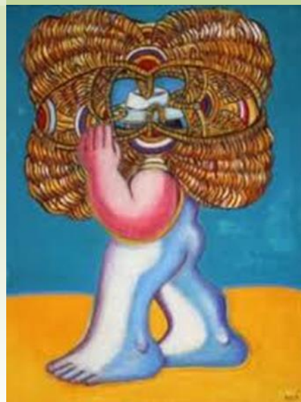
Porteur, huile sur toile, 2002, Salle des travaux du Vin

En 1955, il se décide à partir en Allemagne à Munich, puis dans le Sauerland, situé entre Bonn et Düsseldorf. Il se fixe dans cette dernière ville. C'est dans un contexte très particulier – la ville est encore ravagée par la guerre - qu'il suit la formation du peintre graphiste et sculpteur allemand Otto Pankok (1893 – 1966), un artiste renommé, dont l'art est caractérisé par un fort réalisme expressif. Ayant été taxé d'« artiste dégénéré » par les nazis en 1937, il prend enfin sa revanche après la guerre. Les cours qu'il dispense depuis 1947 à la Kunstakademie de Düsseldorf auront beaucoup d'importance pour notre jeune artiste. Il ne fait aucun doute que German Becerra va partager rapidement l'univers très original de son maître qui est celui d'une humanité souffrante, avec en particulier les « laissés-pour-compte » que sont les migrants, les exilés et les tziganes. Très vite, German se distingue dans cette école en étant nommé Meisterschüler (Maître-élève). En complé-