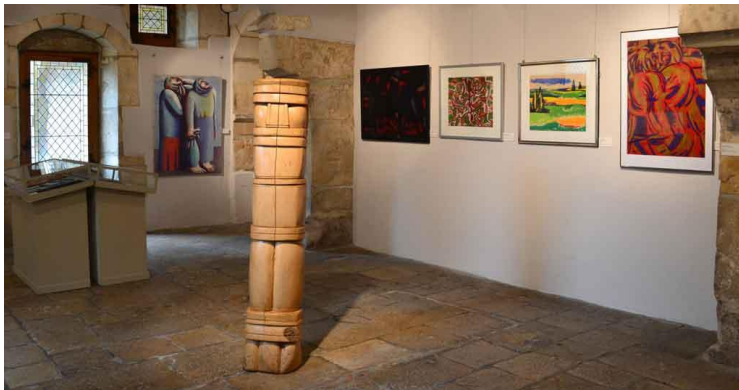
Pastels et sculpture Totem, Salle du Puits

German Becerra a acquis une solide réputation à Düsseldorf où il figure avec plusieurs pièces au sein du musée municipal. Ce musée lui a d'ailleurs consacré en 2003 une exposition rétrospective. Par ailleurs, il a reçu quatre commandes publiques et y a exposé une dizaine de fois, principalement dans des galeries. Son œuvre se retrouve également chez de nombreux collectionneurs privés, en particulier allemands et français. En Bourgogne, il est loin d'être un inconnu. Citons l'exposition de 1984 à la galerie Carnot, celle de 1999 à l'Athenaeum, celle de 2000-2001 au musée du vin déjà citée ainsi que celle au château de Bussy-Rabutin. En 2007, il expose au Conseil régional de Bourgogne et enfin en 2009 dans la salle Michel Tourlière de la Porte Marie de Bourgogne, à l'initiative de l'association Becerra-di Puccio. Présent également en 1993 à la Maison de l'Amérique latine à Paris pour une exposition individuelle, il a exposé tour à tour à Bogota, Cologne, Solingen, Bochum, Kempen et Nancy.